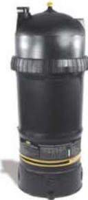
Filtre CFR100 | CFR150 Filter