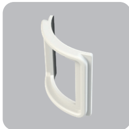
Empaque con recubrimiento de PTFE