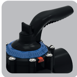
Manija de diseño ergonómico