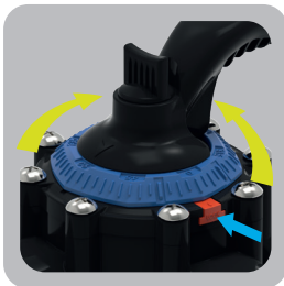
Diseño revolucionario del selector