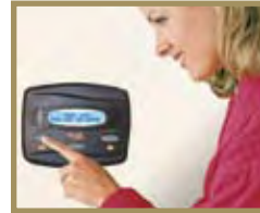
Panel de Control Remoto