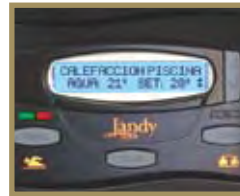
Panel de control LXi