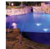
El alto flujo de las bombas MaxHP las hace ideales para aplicaciones que requieren mucho caudal,

Las bombas MaxHP de Jandy son ideales para situaciones que demanden mucho caudal, como cascadas y chorros de agua. Su diseño y propulsor patentado proporcionan un cebado rápido y rendimiento óptimo. Incluyen uniones de conexión rápida de 2" x 2 1/2" y están disponibles en modelos de 3/4 a 2 1/2 hp. Para fácil servicio y mantenimiento, la mayoría de los componentes de las bombas MaxHP son compatibles con las bombas PlusHP.