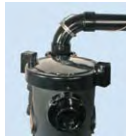
Bombas Stealth con codo (Sweep Elbow)

Brindan rendimiento y eficiencia superior, incorporando "tecnología silenciosa", las rediseñadas bombas Stealth elevan aún más la calidad de nuestras bombas. Poseen la canasta más grande del mercado. Están diseñadas para una fácil instalación, mantenimiento sin inconvenientes y máxima eficiencia. Las bombas Stealth pueden operar fácilmente todas las necesidades de su piscina y spa.